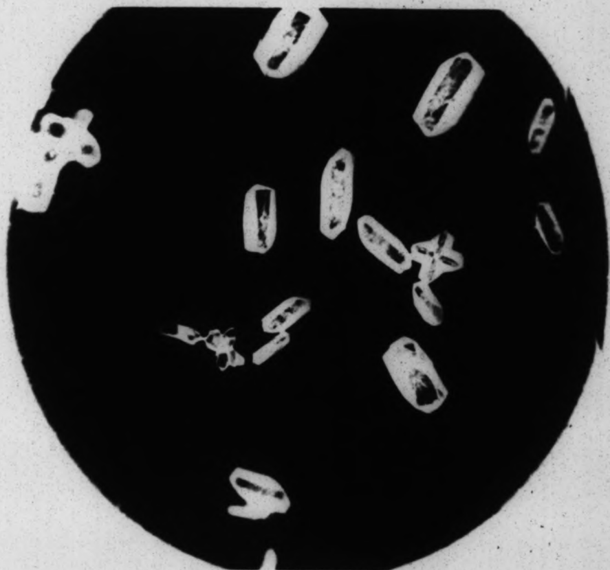
Hemibilirubin bei langsamer Krystallisation