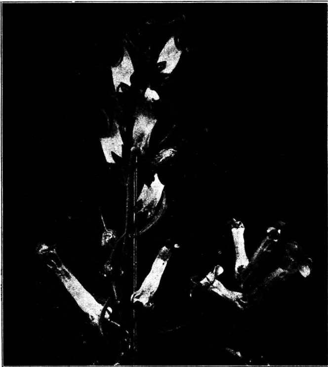
Fig. 1. Blüten von A. 331 (A) und A. 14 (B).

Ebenso wie in Bezug auf Blütenfarbe, gibt es auch in bezug auf Blütenform eine Reihe von erblich konstanten Rassen. Auch