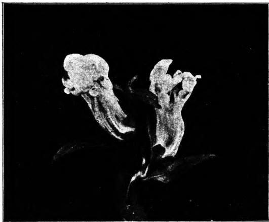
Fig. 2. Blüten von A. 312.

Vermutlich wird sich herausstellen, daß auch die normale zygomorphe Blütenform von einer größeren Anzahl von Erbinheiten abhängt, und daß das Fehlen einzelner oder mehrerer von diesen Faktoren die anderen Blütenformen, Schlitzer, wie Textfigur 2, radiäre Pelorien, Textfigur 1 A und B, Apetala-Formen, wie in Textfigur 3 abgebildet, und ähnliche Blütentypen mit sich bringt. Die Klärlegung dieser Verhältnisse wird wohl noch die Arbeit einiger Jahre kosten.